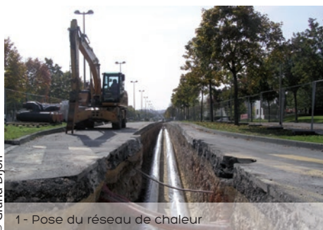
1 - Pose du réseau de chaleur