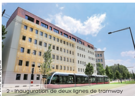
2 - Inauguration de deux lignes de tramway