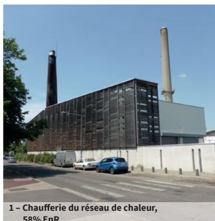
1 - Chaufferie du réseau de chaleur, 58% EnR

Cet appel s'adresse à tous ceux qui ont un projet durable sur la commune. Il s'agit d'un coup de pouce financier et technique permettant de réaliser des actions locales partagées, portées par les habitants ou groupe d'habitants, associations et structures éducatives, et servant l'intérêt général. 6 à 10 éco-projets sont soutenus chaque année pour un budget d'environ 5 000 €.