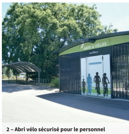
2 - Abri vélo sécurisé pour le personnel