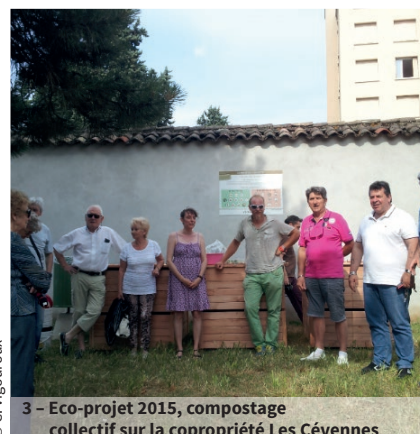
3 - Eco-projet 2015, compostage collectif sur la copropriété Les Cévennes