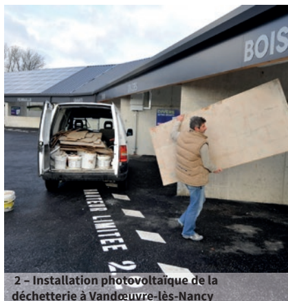
2 - Installation photovoltaïque de la déchetterie à Vandœuvre-lès-Nancy