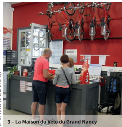
3 - La Maison du Vélo du Grand Nancy