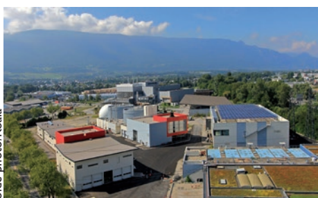
2 - Rénovation de l'usine de dépollution de l'eau