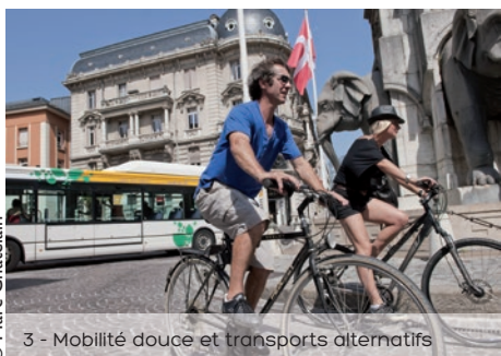
3 - Mobilité douce et transports alternatifs