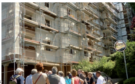
1 - Rénovation énergétique de logements privés

Un service de conseil en énergie partagé a été créé en 2012 (assuré par l'ASDER). Il accompagne sept communes adhérentes en 2013.